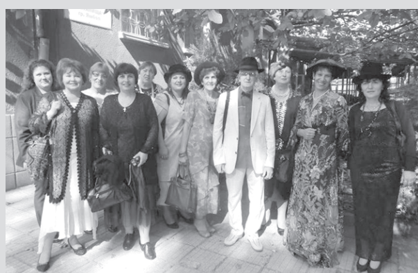
Втора награда и парична сума за вокална група "Романс" на фестивал на градската песен под наслов "Ямболска есен - 2014" в гр. Ямбол.