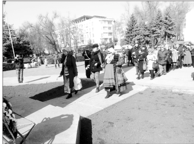
Полагане на цветя до обелиска в Кишинев

та се полагат пред бюст-памятника на майор Олимпий Панов, който участва в Руско-турската война 1877-1878 г. като опълченец в 1-ва рота на 1-ва Опълченска дружина. Участва в боевете при