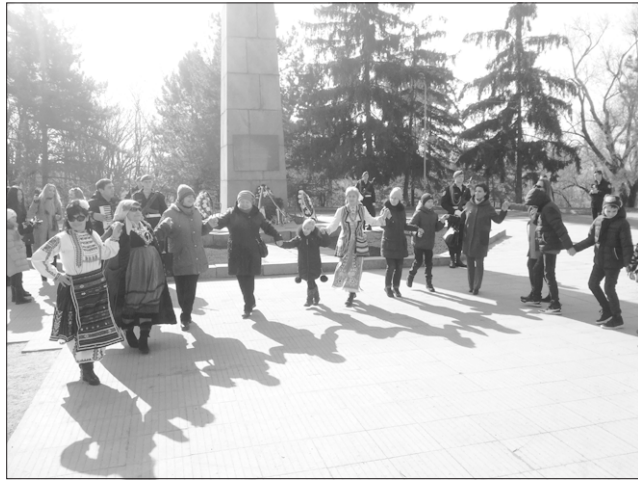
Хоро за 3 март в Кишинев

Сега онова поле се нарича Площад на опълченците.