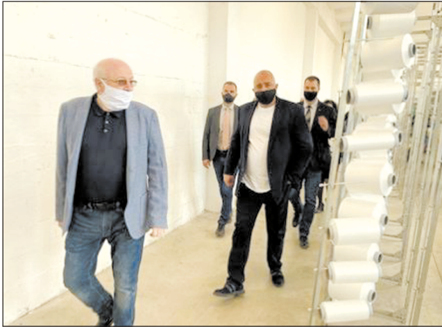
фабрика след въвеждането на извънредно положение. "Нека българите да видят как в тези условия има предприятия, които се справят героически в подкрепа на хората на първа линия" - каза по време на посещението си премиерът Борисов.