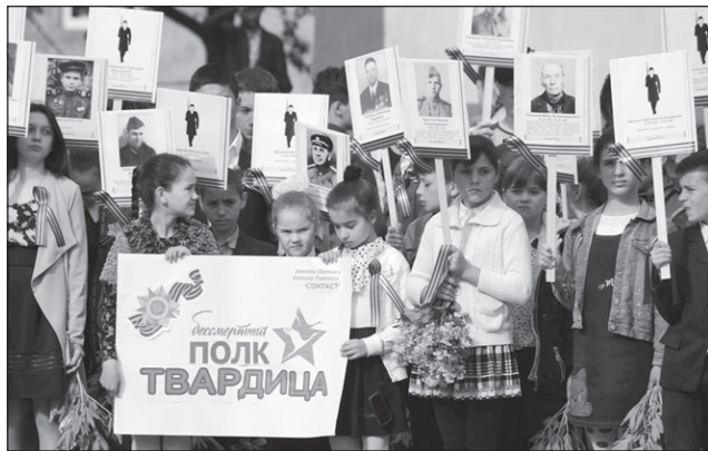
Акция „Безсмъртен полк“

Младежта премина по централната улица, носейки пор-