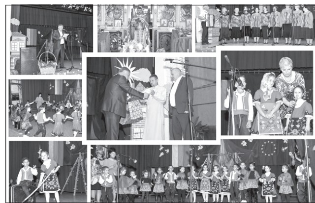
черта на Спасовден оркестър