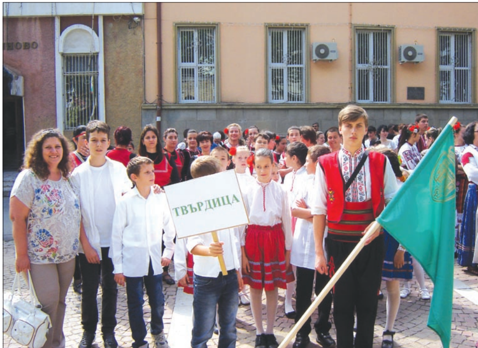
Фоторазказ - на стр. 8

Празникът "Балканът пее и разказва" е уникално културно събитие, което вече 41 години свързва градовете от двете страни на Стара планина: Елена, Трявна, Дряново, Котел, Твърдица и Гурково. Запазвайки традиционното присъствие на фолклорната култура, празникът се развива и обогатява с всяко следващо издание. Организират се изложби и базари на местни творци и традиционни занаяти, популяризира се в местните и регионалните медии. Празникът е включен в Националния културен календар. Тази година домакин на проявата беше град Дряново.