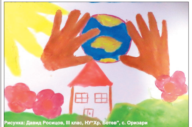
Рисунка: Давид Росицов, III клас, НУ "Хр. Ботев", с. Оризари

вия между Регионалните управления на образованието, образователните институции, дирекции за социално подпомагане, кметствата по места и полицията с цел всяко дете да бъде обхванато и въведено в училище.