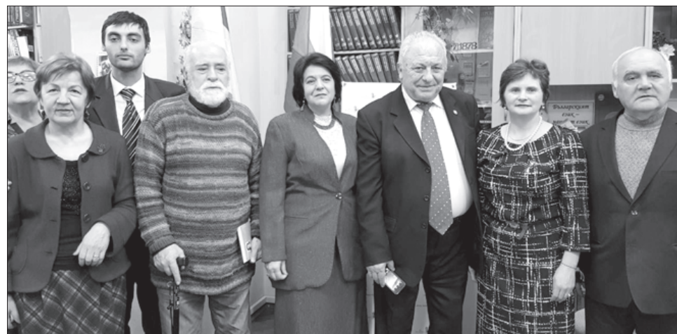
С представители на българската общественост в Кишинев, 2018 г.