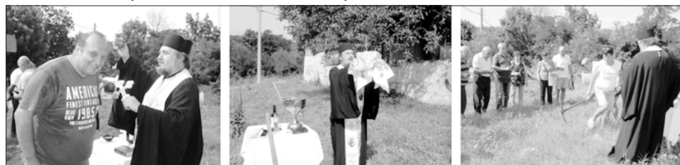
На 10 август беше направена първата копка на параклиса "Света Петка" в с. Близнец

В село Сърцево предстои ограждане на гробищния парк и построяване на чешма.