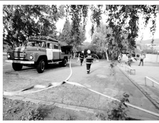
По случай 14 септември - професионален празник на пожарната безопасност, в ДГ „Щастливо детство“ - Твърдица, се проведе демонстративно занятие